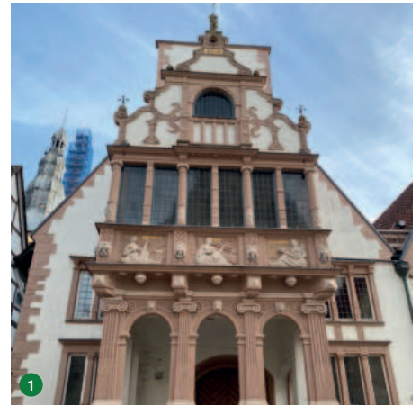
Bürgerhaus in Minden von 1590 im Stil der Weserrenaissance