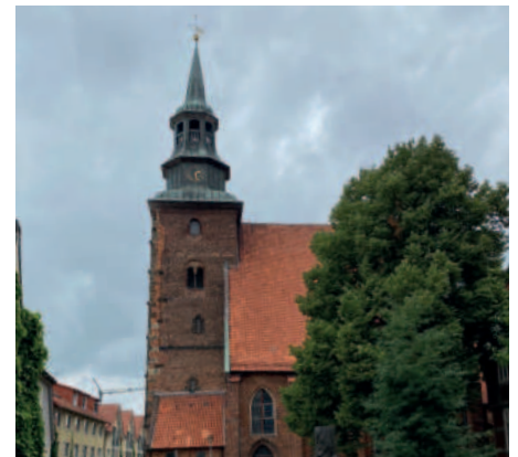
St. Johannes Turm in Verden