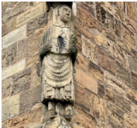
Dom Verden: Der Mönch von der Sonnenuhr - Oberkirchener Sandstein inmitten von Porta Sandstein