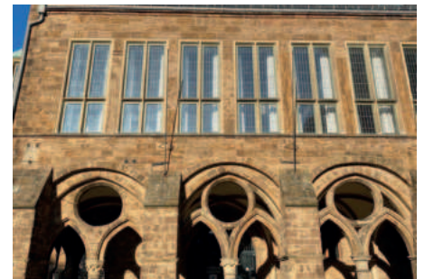
Rathaus mit Laubengang in Minden