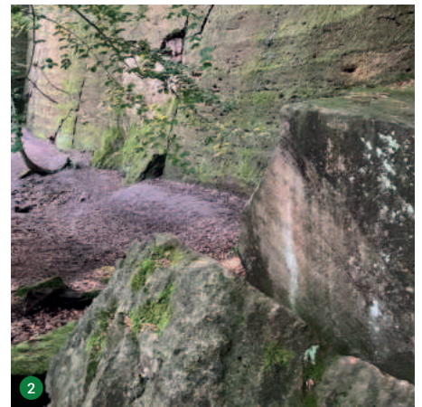
Aufschluss Porta Sandstein am Jakobsberg