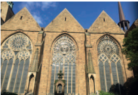
Gotische Halle des Doms in Minden

Hilke Domsch • GKZ Freiberg e.V. • Korngasse 1 • 09599 Freiberg +49 3731 773714 • +49 1525 4297233 hilke.domsch@gkz-ev.de