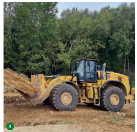
Obernkirchner Sandstein Gewinnung und Verarbeitung