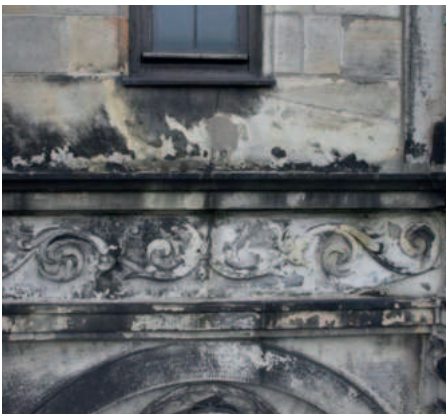
Schadensbild Oberkirchener Sandstein an der Handelskammer Bremen Schütting

500,00 EUR netto • zuzügl. 7% MwSt. 535,00 EUR brutto