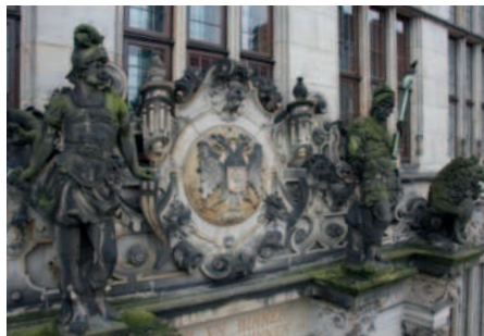
Schadensbild Obernkirchener Sandstein, Bremen